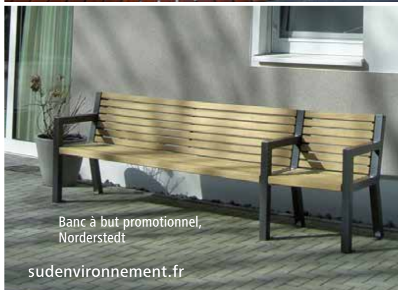
Banc à but promotionnel, Norderstedt