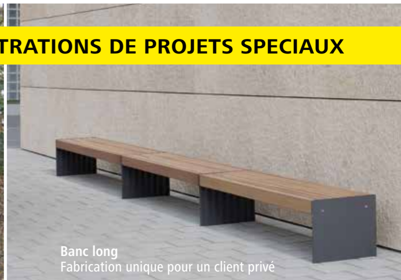
Banc long Fabrication unique pour un client privé