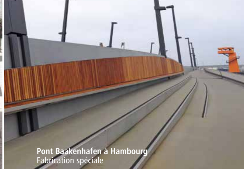
Pont Baakenhafen à Hambourg Fabrication spéciale