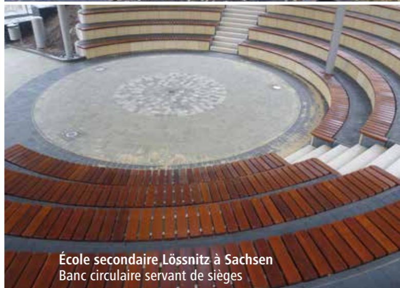
École secondaire Lössnitz à Sachsen Banc circulaire servant de sièges