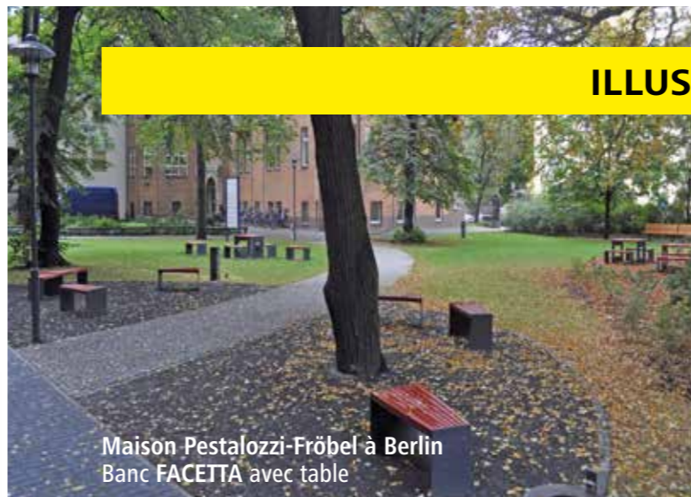
Maison Pestalozzi-Fröbel à Berlin Banc FACETTA avec table