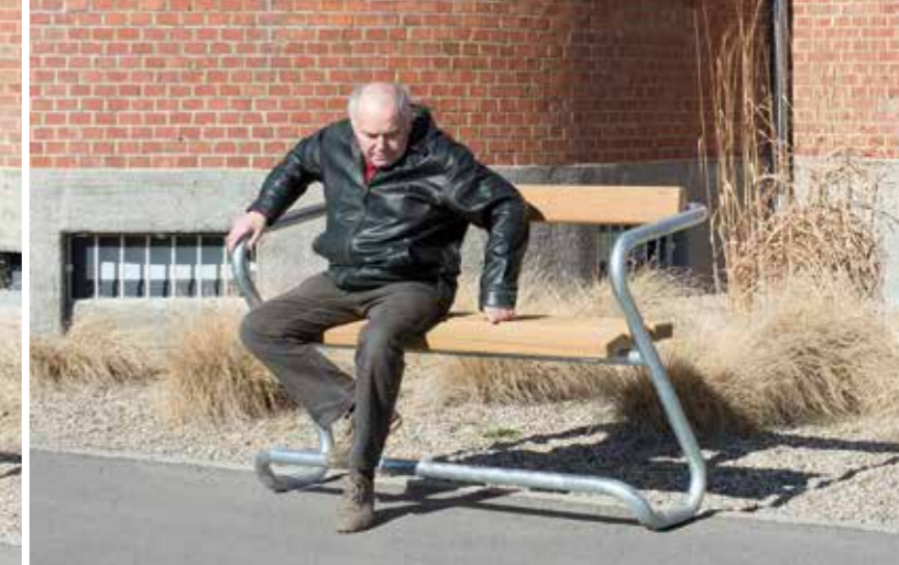
BANC HOCHSITZ ReGerO

Banc avec repose-pied pour une assise surélevée et ergonomique, et qui facilite le lever. Convient de ce fait à tous les âges. Armature en tubes d'acier stables, zingués à chaud. Disponible en bois dur FSC.