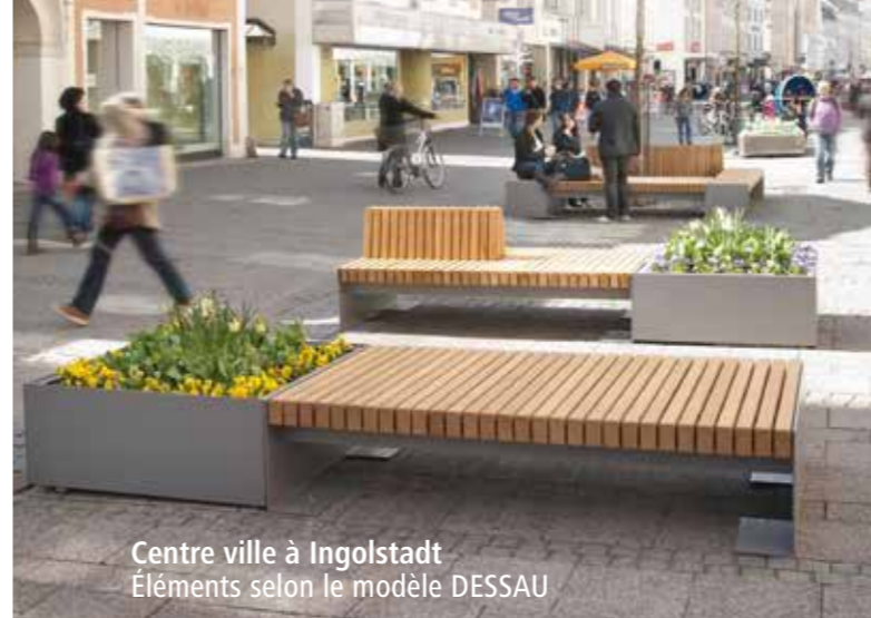
Centre ville à Ingolstadt Éléments selon le modèle DESSAU