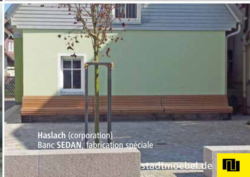
Haslach (corporation) Banc SEDAN, fabrication spéciale