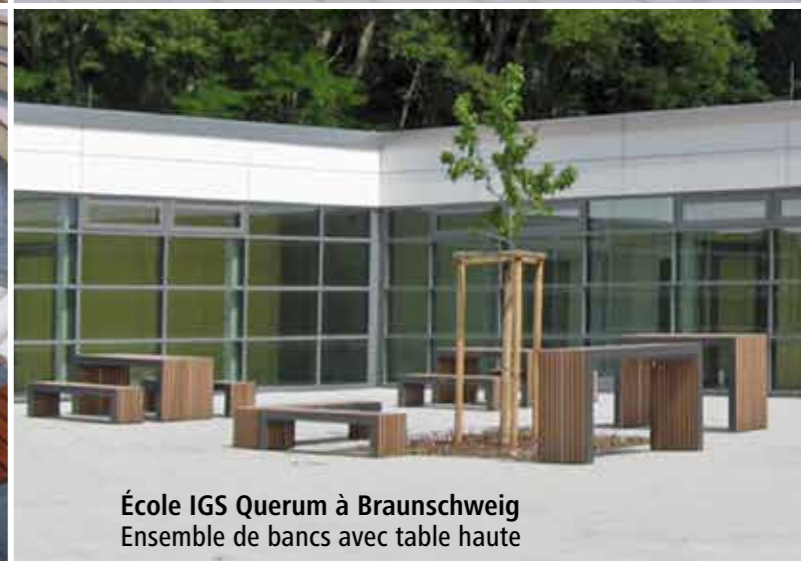
École IGS Querum à Braunschweig Ensemble de bancs avec table haute