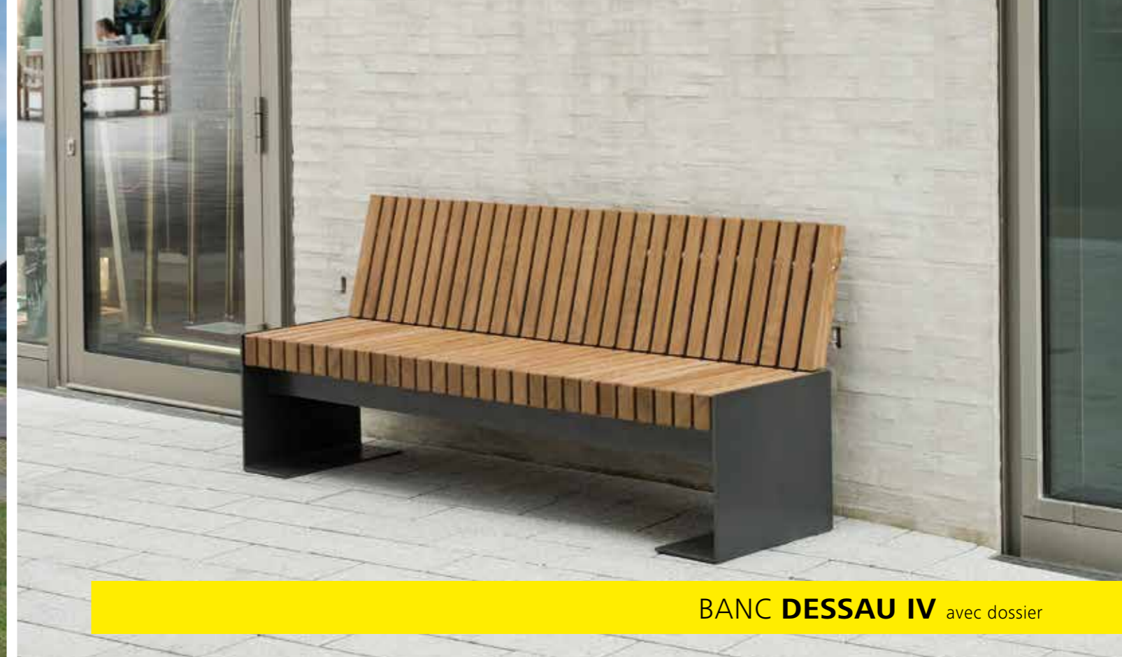
BANC DESSAU IV avec dossier

Banc avec pieds en acier plat, zingués à chaud et thermopoudrés. Couleur standard gris-anthrax, similaire au RAL DB 703. Disponible en Douglas ou bois dur FSC.