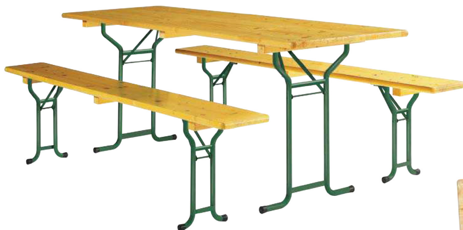
Table et banc Vienne