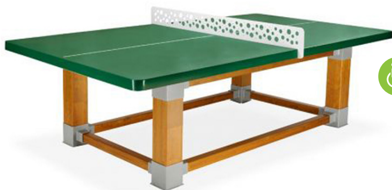
Table de ping-pong Natura 60