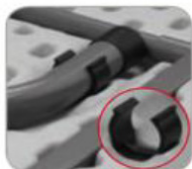
Accroche de polypropylène individuelle pour maintenir le pied dans son écrou quand plié. Dispositif d'attache solide et durable.