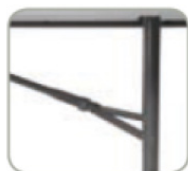
Anneau de sécurité pour bloquer les pieds quand la table est dépliée. Facile et sûr.