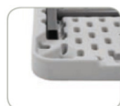
Profils métalliques avec épaisseur conçue pour supporter de lourdes charges.