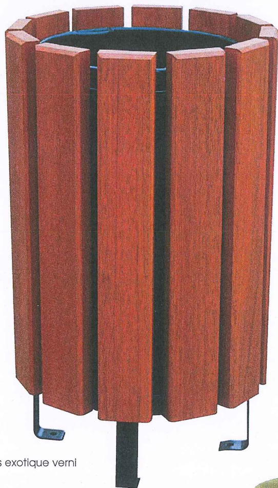
bois exotique verni