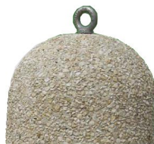
Option : Anneau au sommet