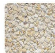
Gravillons lavés beige 4/10 sur un fond ciment blanc