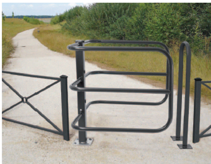
Galva Réf. 203215 Peint sur galva Réf. 203265