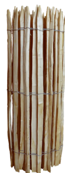
Rouleaux de 5 ou 10 m