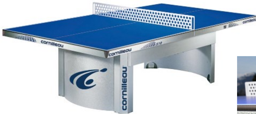
Table ping pong