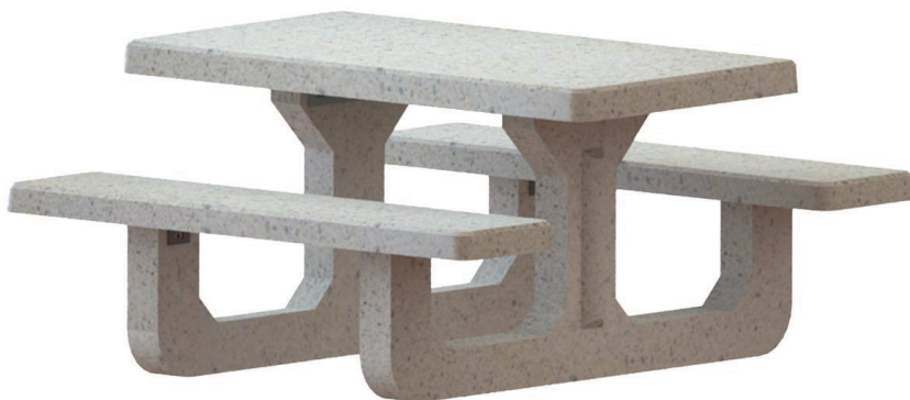
Table pique nique béton Rio