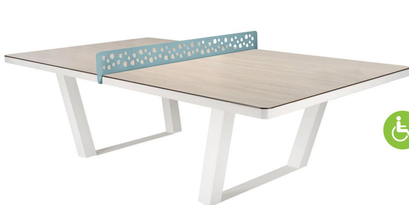
Table de ping-pong Garden