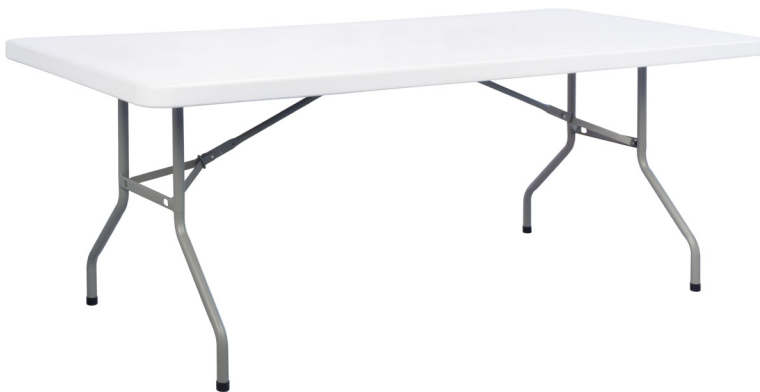
Table pliante rectangulaire PEHD 200 x 90 cm