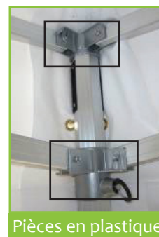
Pièces en plastique