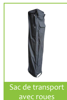
Sac de transport avec roues