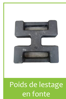
Poids de lestage en fonte