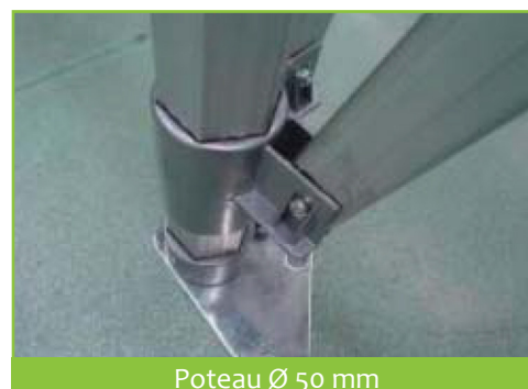
Poteau Ø 50 mm