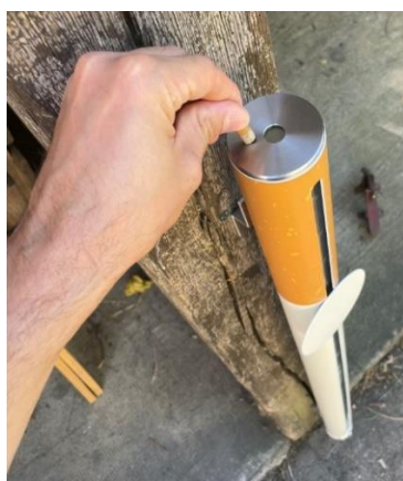
Ecrasez sur le disque